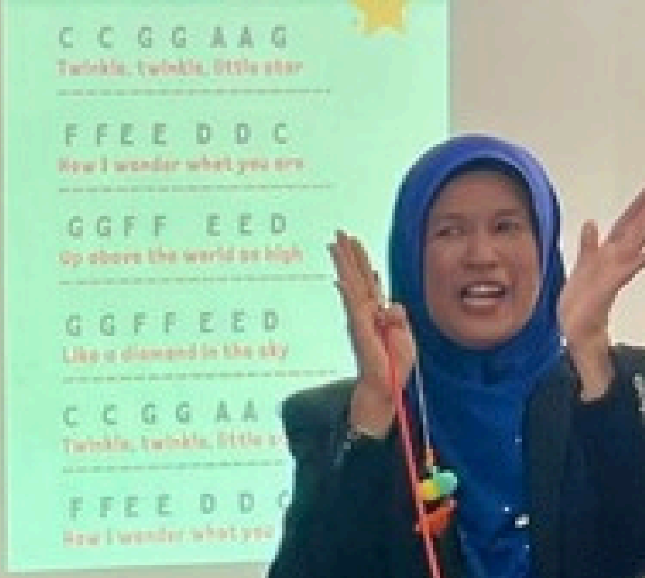
Gambar ketika lawatan YB Menteri ke Prasekolah SK Seri Samudera

RM 1 juta diperuntukkan untuk Geran Alat Bantu Mengajar.