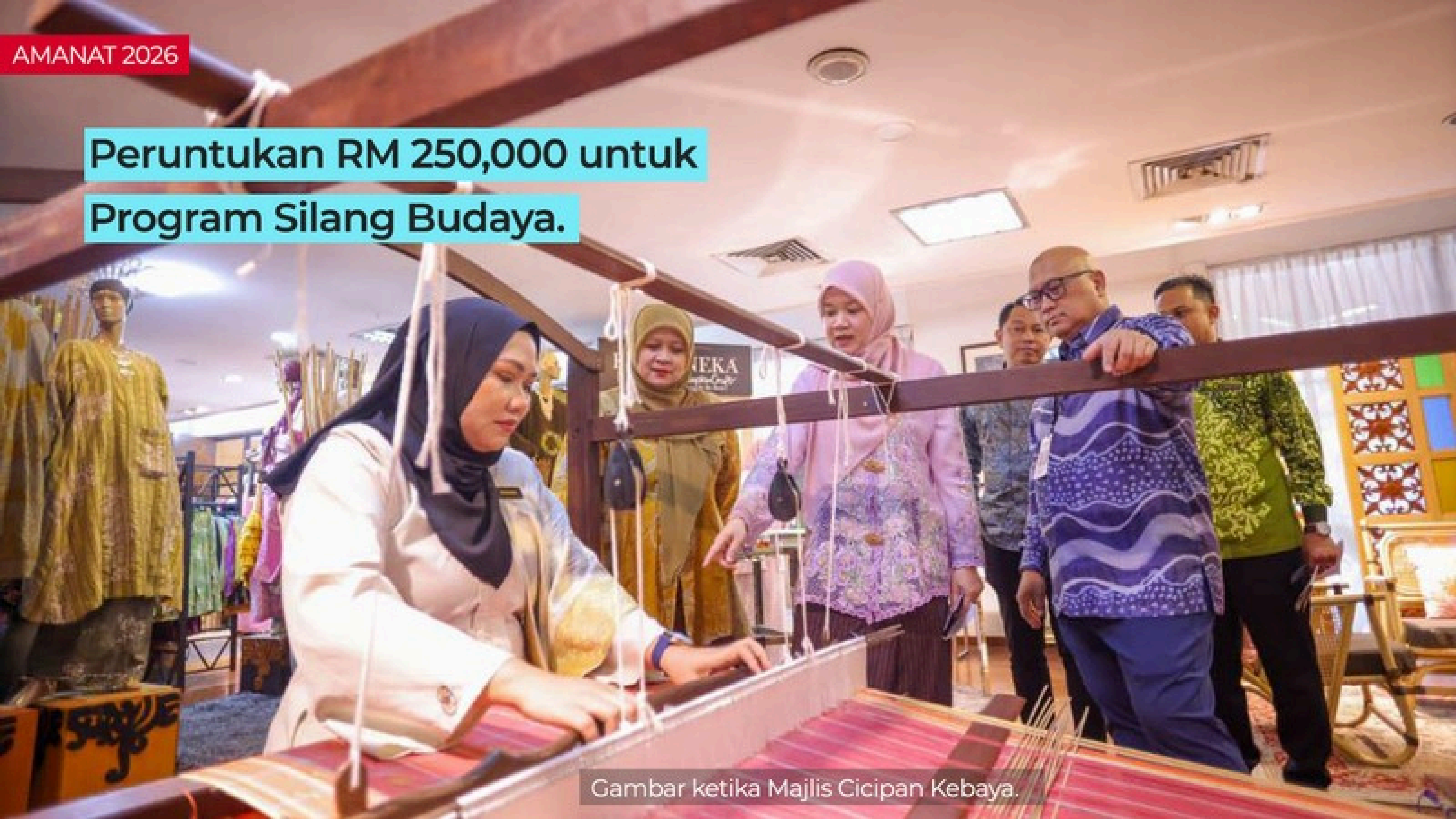
Gambar ketika Majlis Cicipan Kebaya.