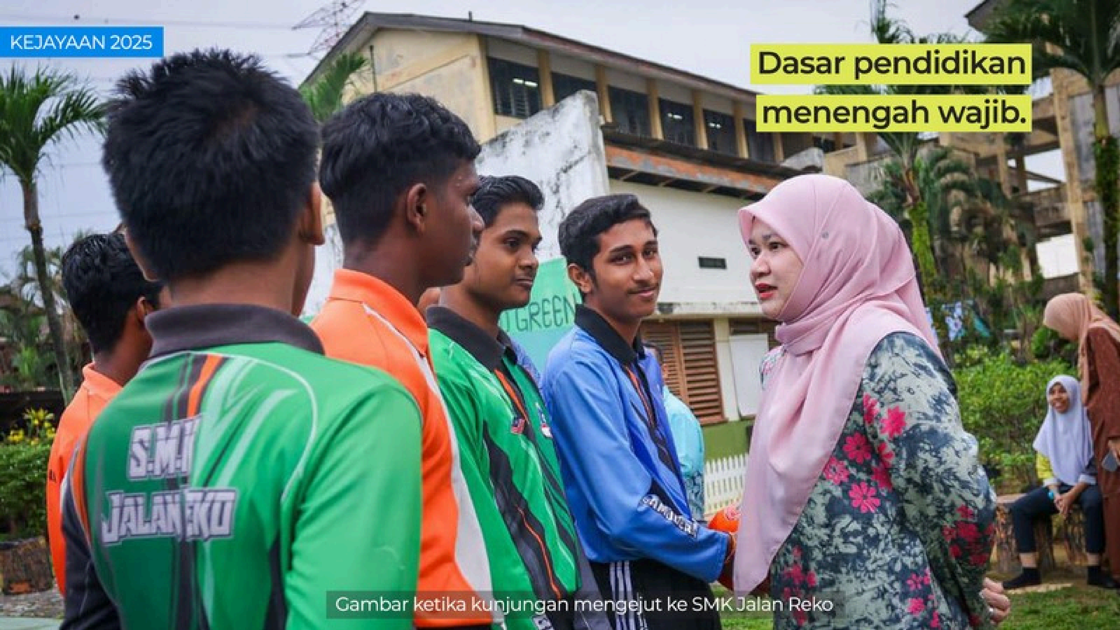
Gambar ketika kunjungan mengejut ke SMK Jalan Reko