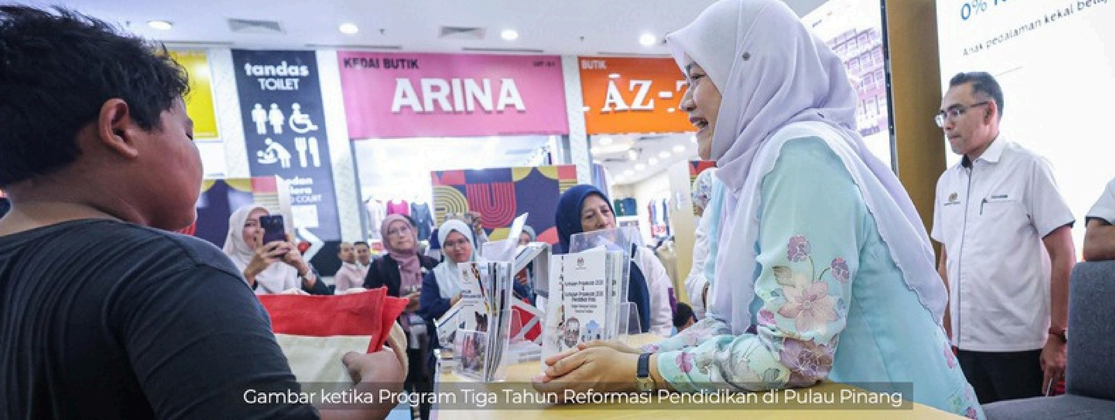
Gambar ketika Program Tiga Tahun Reformasi Pendidikan di Pulau Pinang

KPM menyasarkan pertambahan 350 kelas prasekolah.