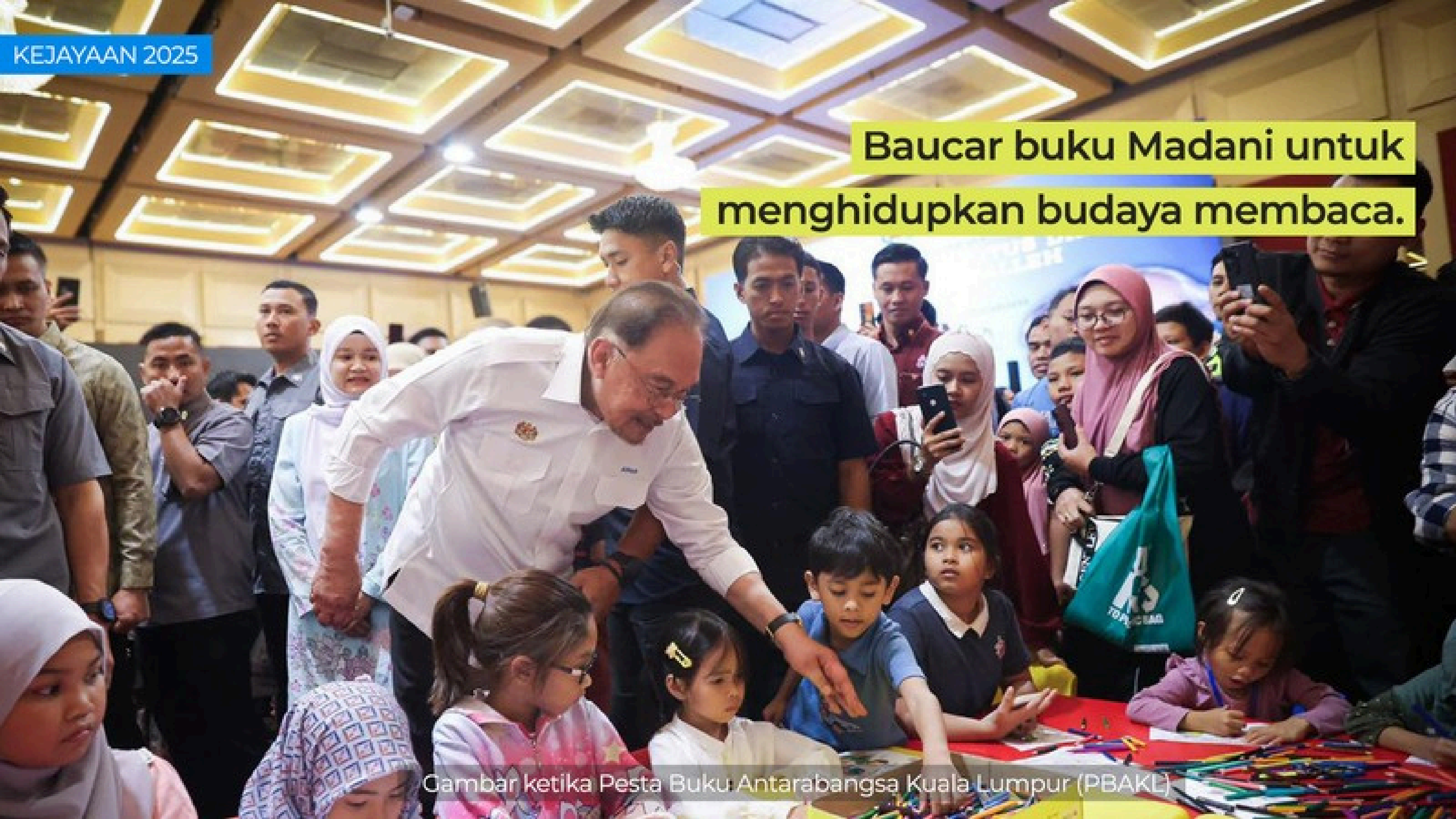
Gambar ketika Pesta Buku Antarabangsa Kuala Lumpur (PBAKL)

Baucar buku Madani untuk menghidupkan budaya membaca.