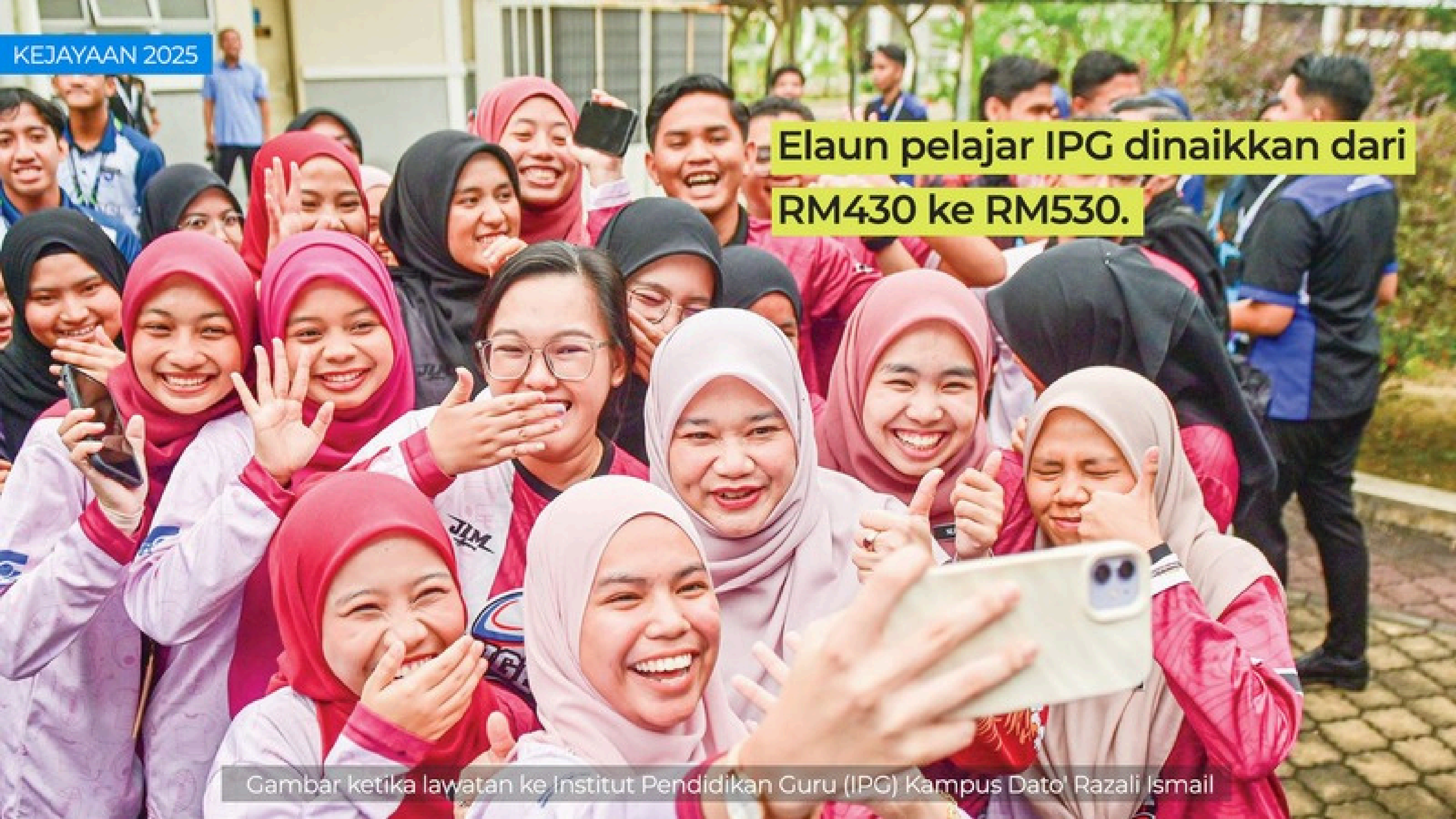
Gambar ketika lawatan ke Institut Pendidikan Guru (IPG) Kampus Dato' Razali Ismail

Elaun pelajar IPG dinaikkan dari RM430 ke RM530.