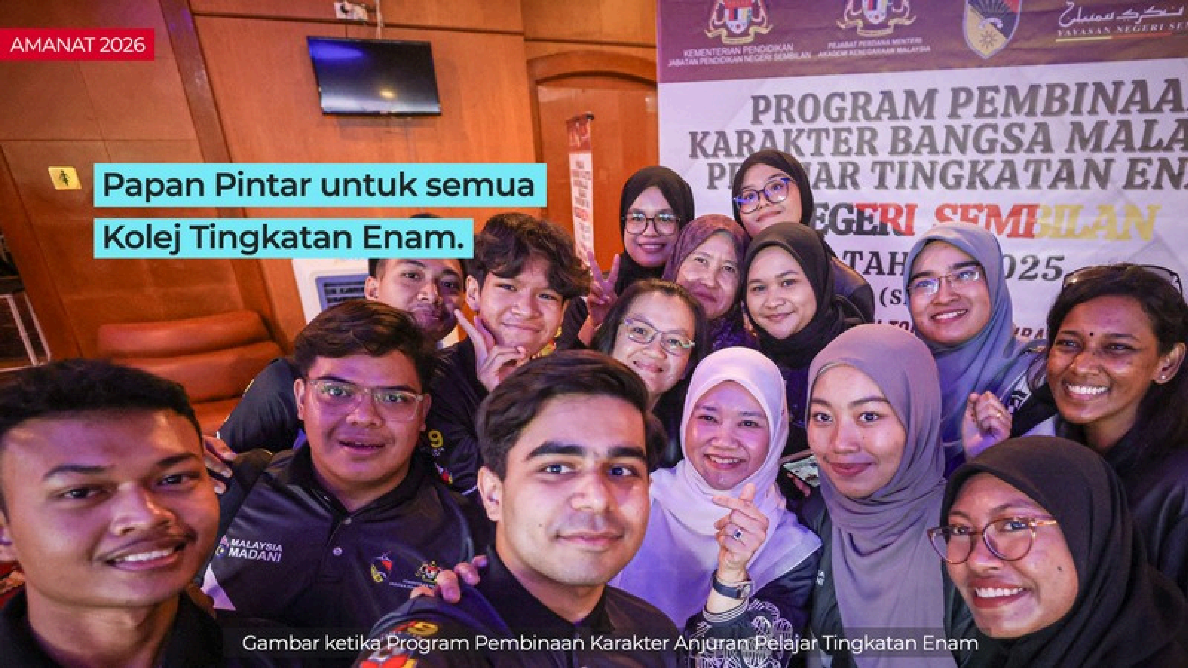
Gambar ketika Program Pembinaan Karakter Anjuran Pelajar Tingkatan Enam