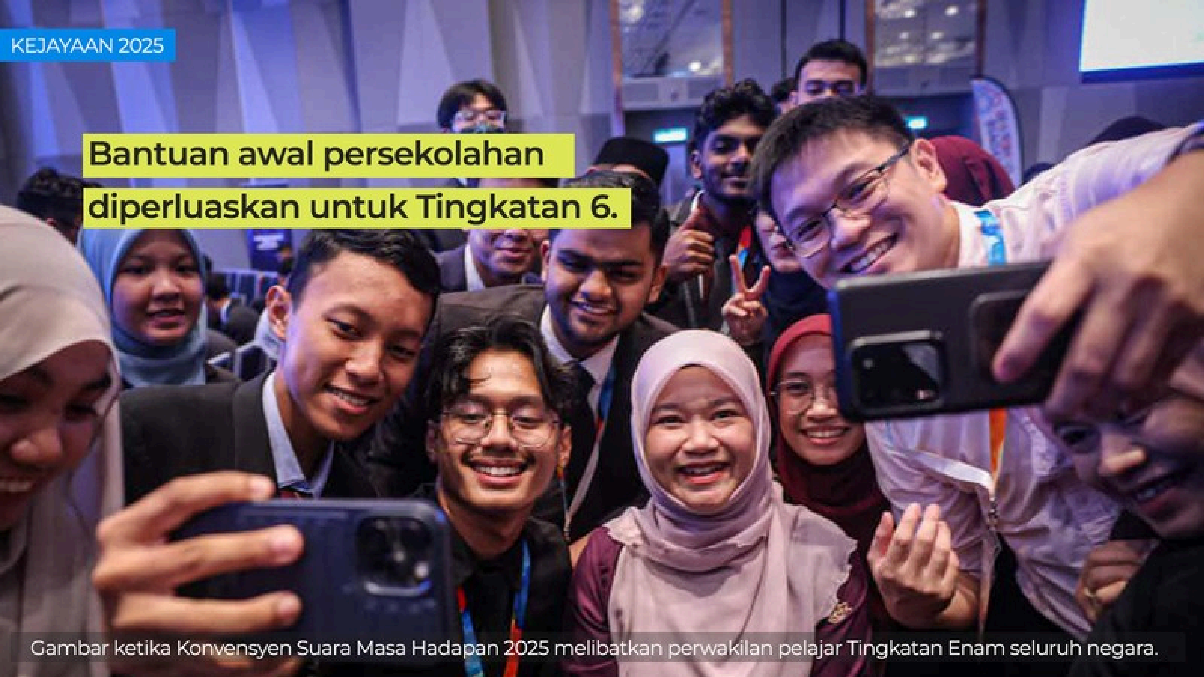
Gambar ketika Konvensyen Suara Masa Hadapan 2025 melibatkan perwakilan pelajar Tingkatan Enam seluruh negara.

Bantuan awal persekolahan diperluaskan untuk Tingkatan 6.