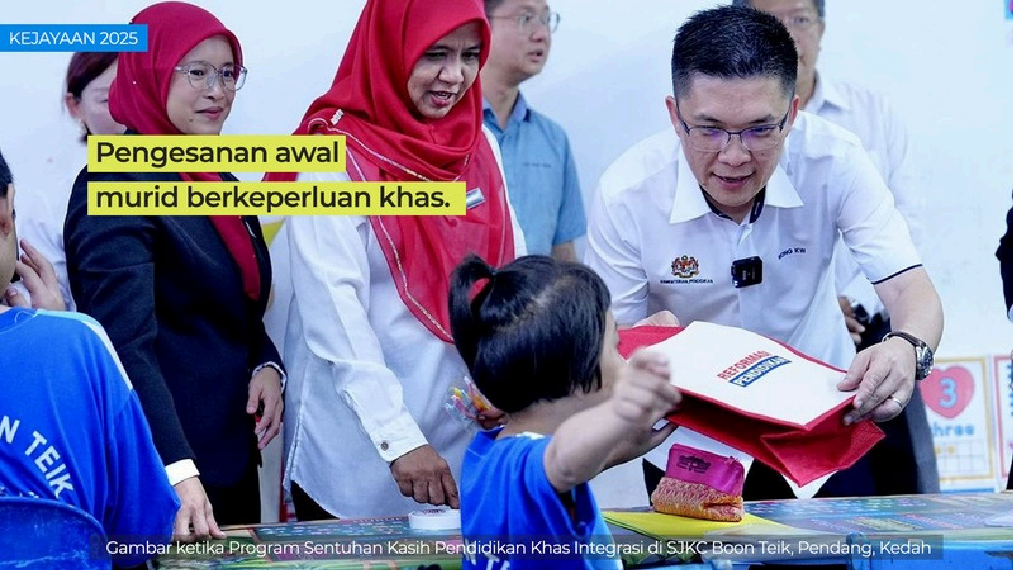
Gambar ketika Program Sentuhan Kasih Pendidikan Khas Integrasi di SJKC Boon Teik, Pendang, Kedah

Pengesanan awal murid berkeperluan khas.