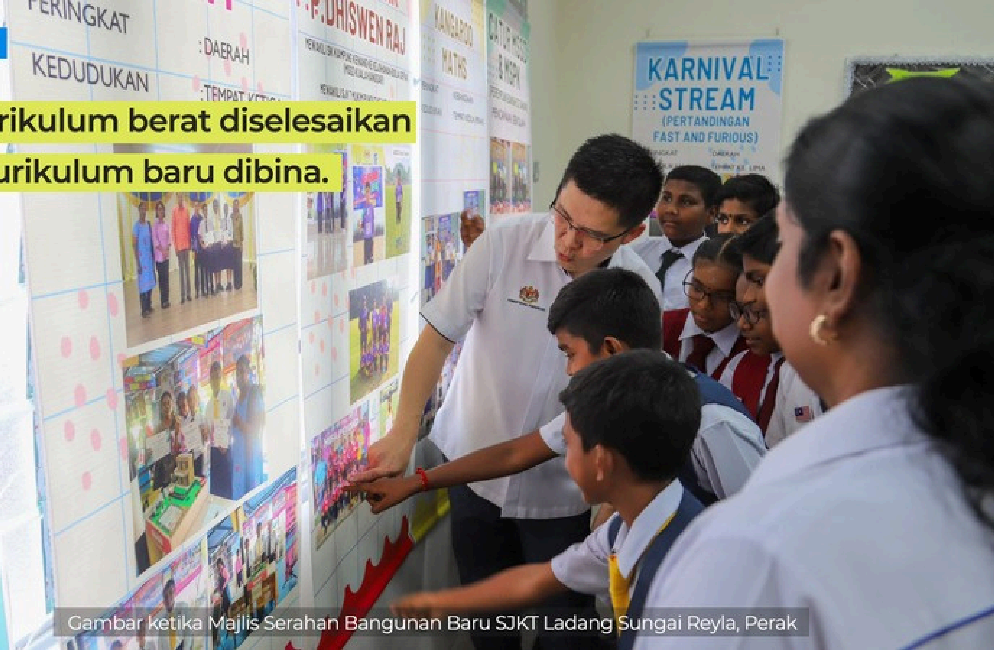
Gambar ketika Majlis Serahan Bangunan Baru SJKT Ladang Sungai Reyla, Perak