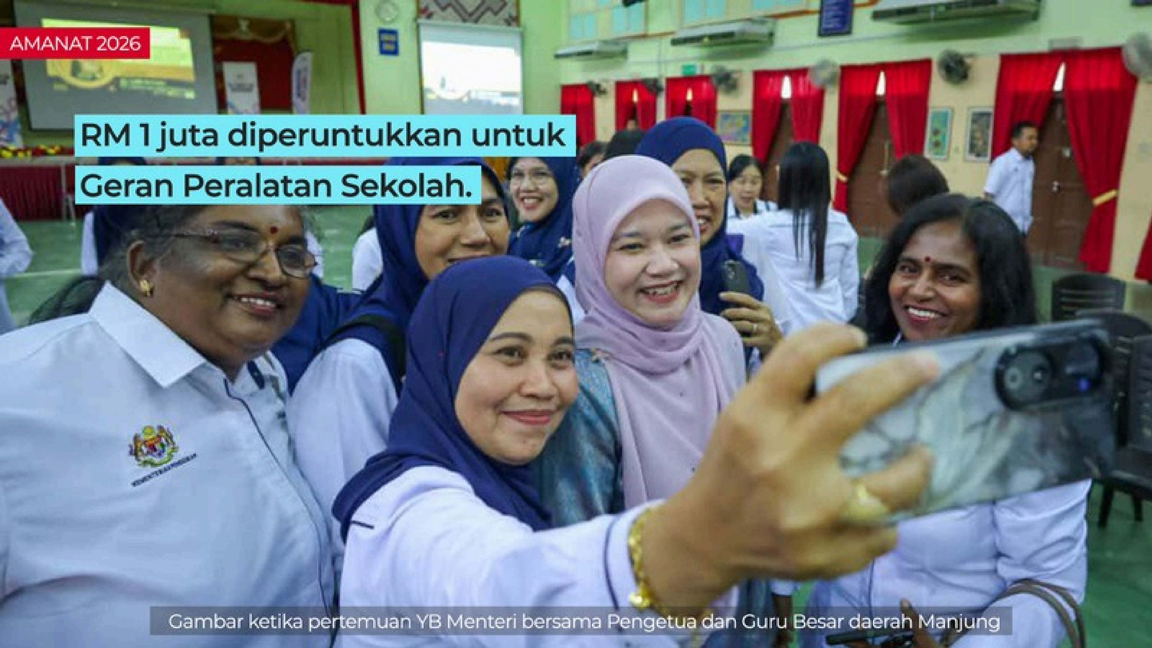
Gambar ketika pertemuan YB Menteri bersama Pengetua dan Guru Besar daerah Manjung

RM 1 juta diperuntukkan untuk Geran Peralatan Sekolah.