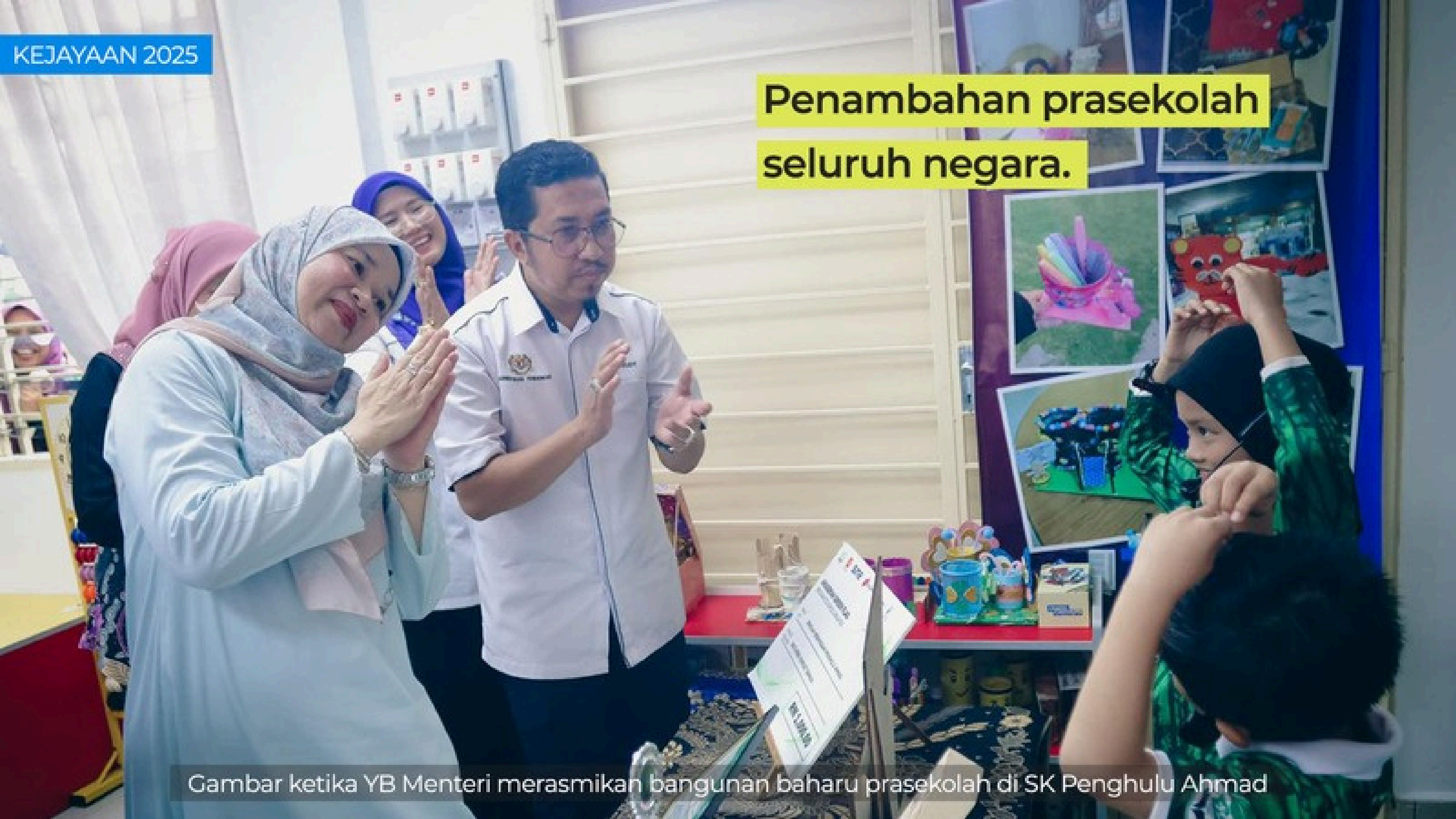
Gambar ketika YB Menteri merasmikan bangunan baharu prasekolah di SK Penghulu Ahmad