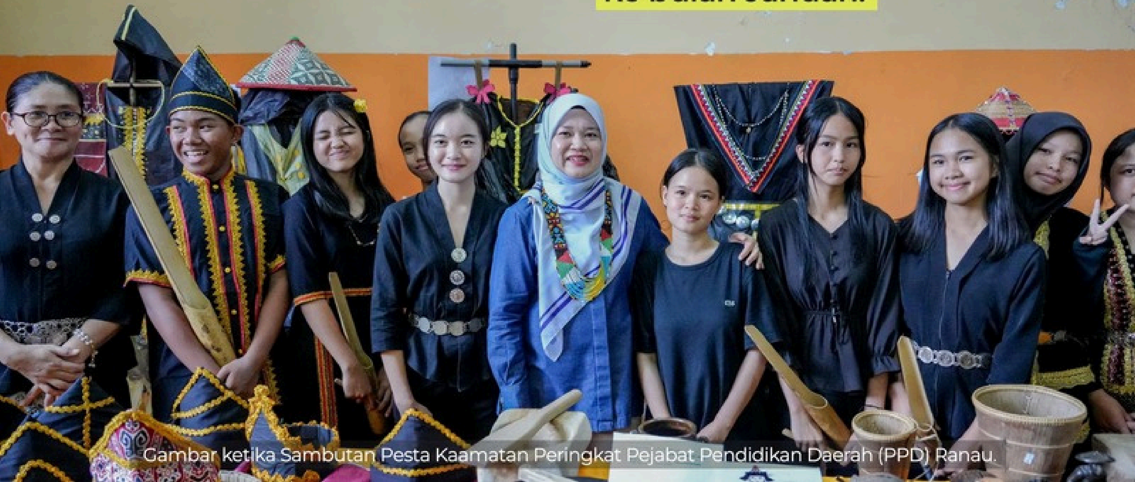
Gambar ketika Sambutan Pesta Kaamatan Peringkat Pejabat Pendidikan Daerah (PPD) Ranau.