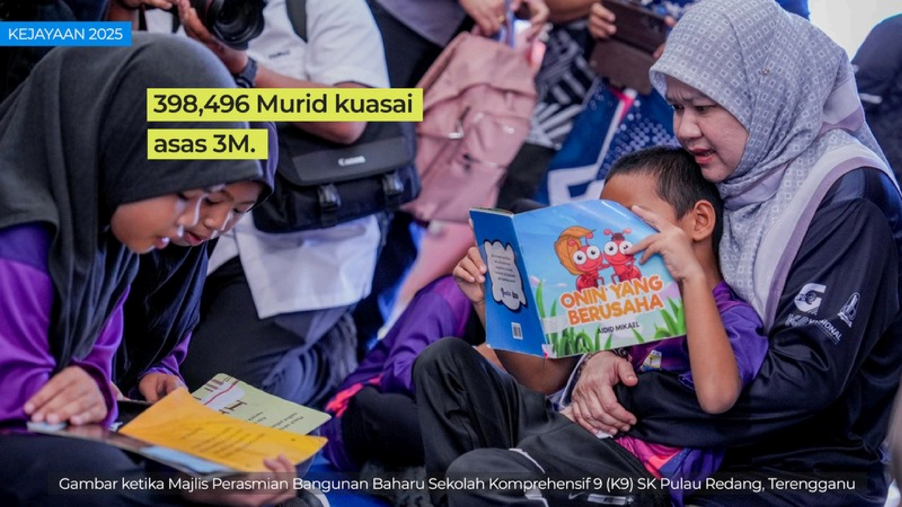
Gambar ketika Majlis Perasmian Bangunan Baharu Sekolah Komprehensif 9 (K9) SK Pulau Redang, Terengganu