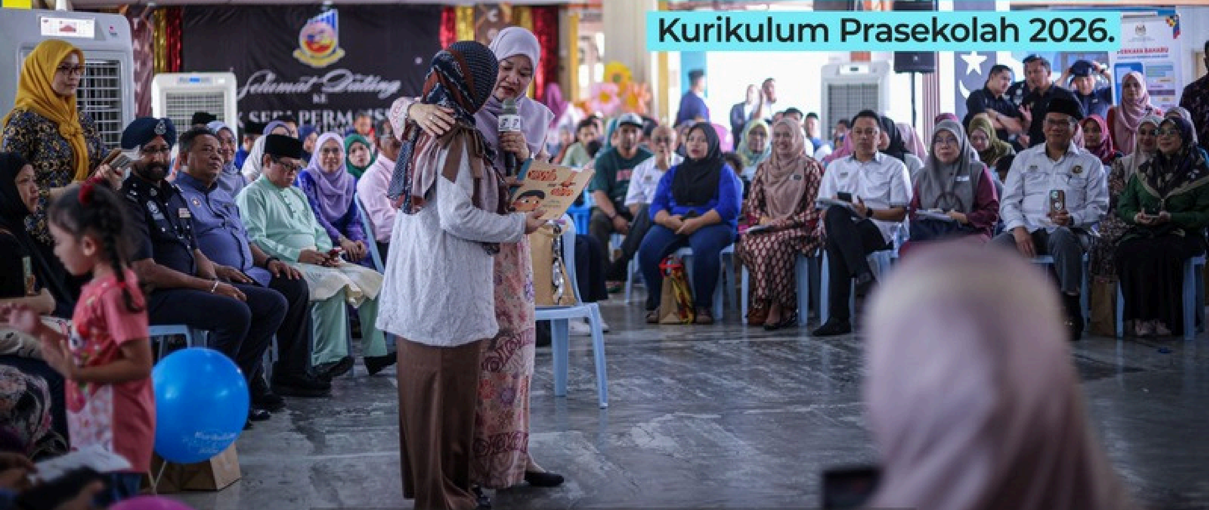
Gambar ketika Program PAKAT: Kurikulum Prasekolah 2026