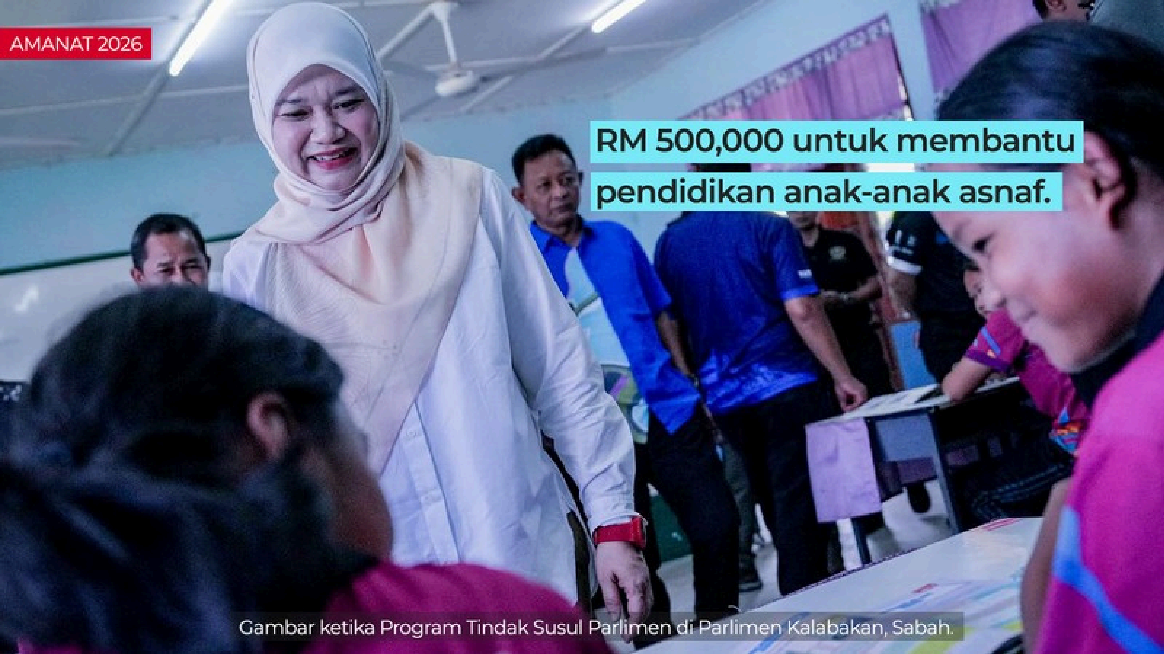
Gambar ketika Program Tindak Susul Parlimen di Parlimen Kalabakan, Sabah.

RM 500,000 untuk membantu pendidikan anak-anak asnaf.