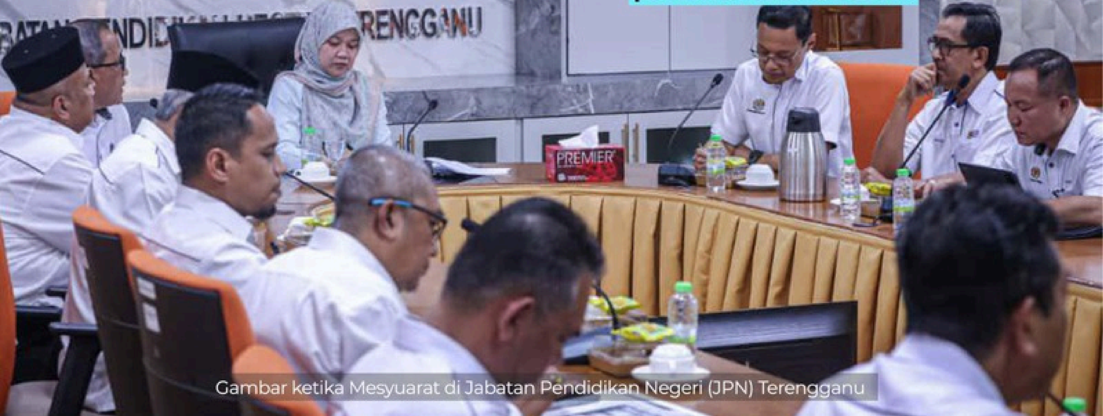
Gambar ketika Mesyuarat di Jabatan Pendidikan Negeri (JPN) Terengganu