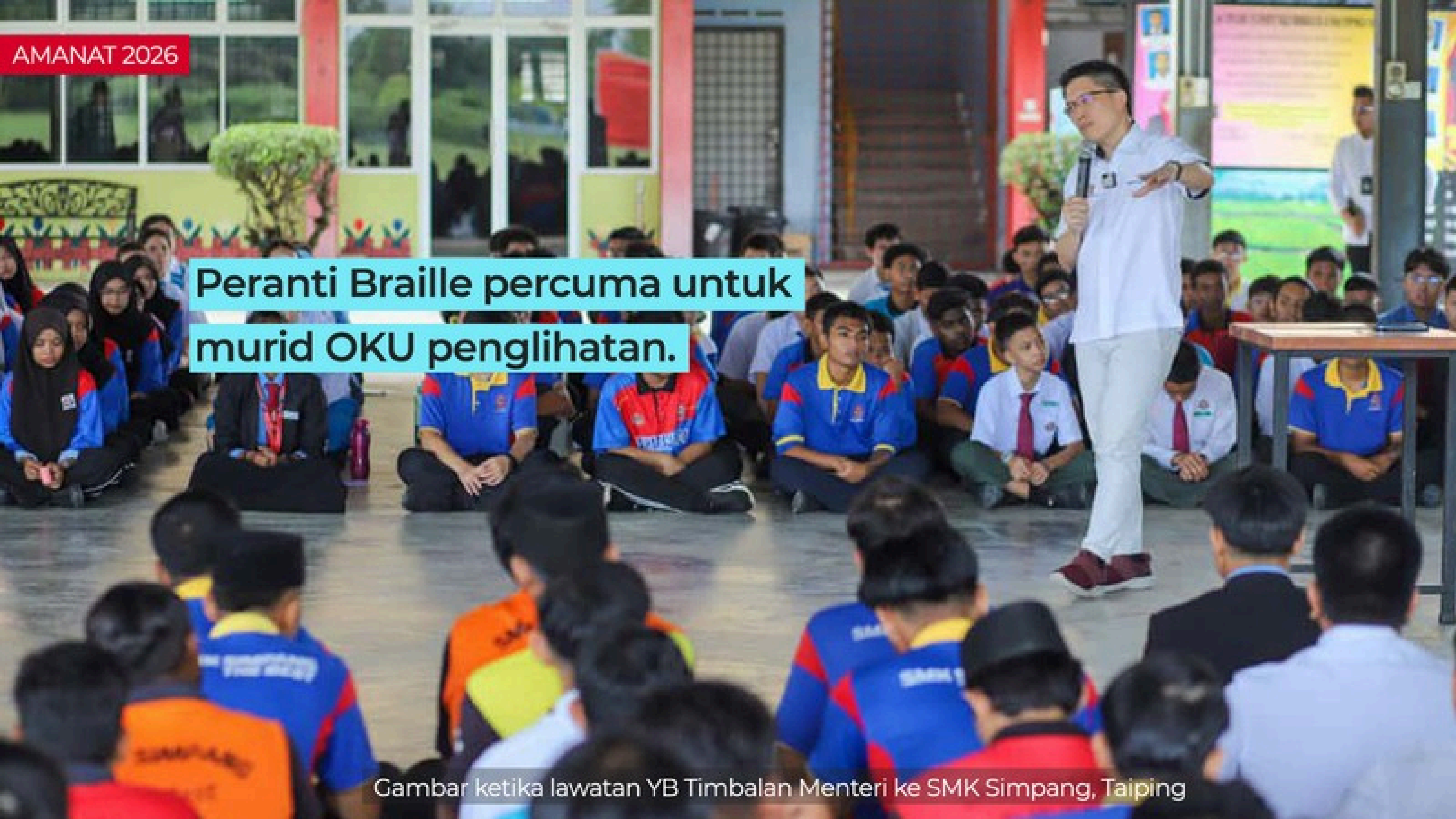
Gambar ketika lawatan YB Timbalan Menteri ke SMK Simpang, Taiping

Peranti Braille percuma untuk murid OKU penglihatan.