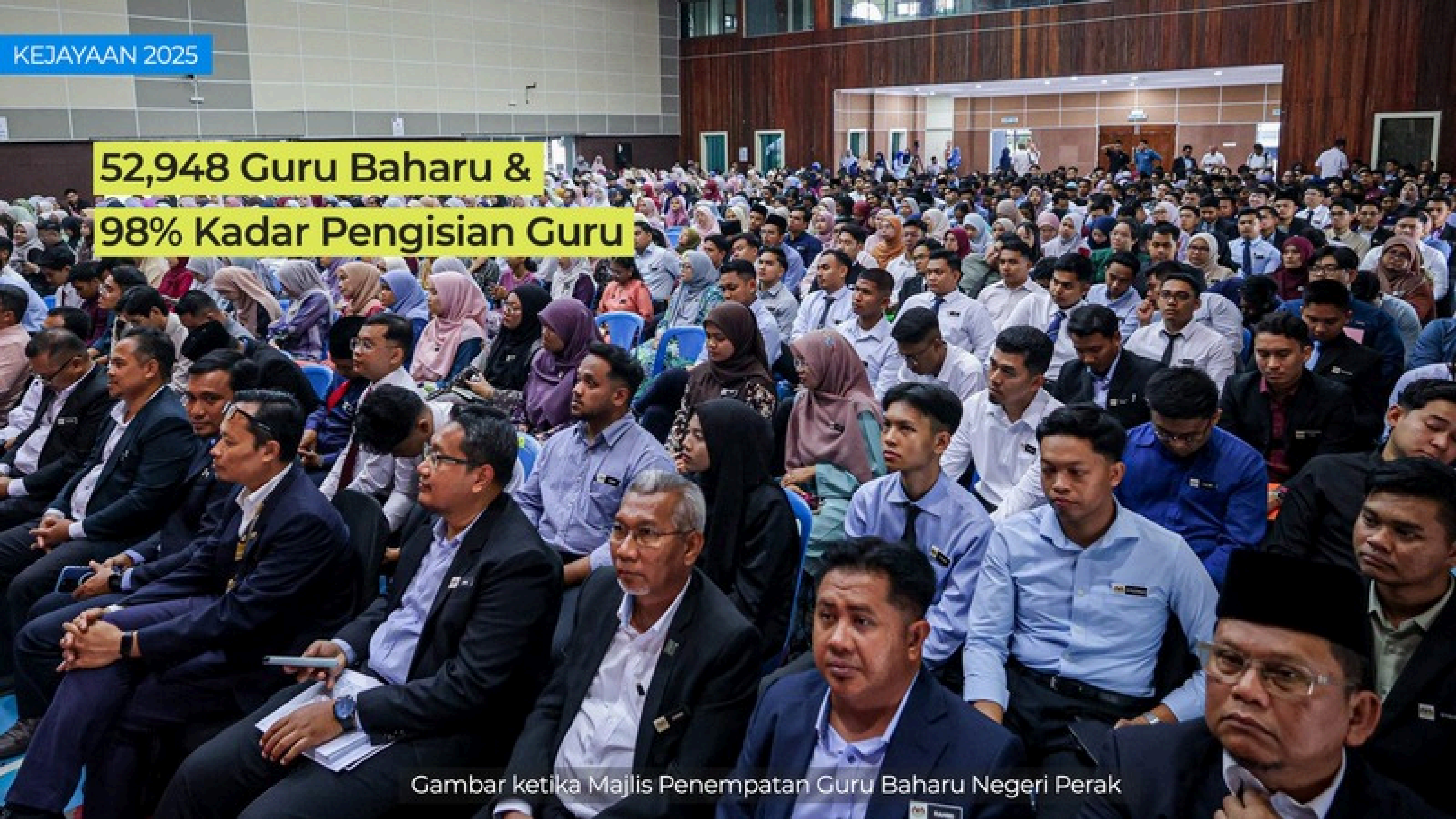
Gambar ketika Majlis Penempatan Guru Baharu Negeri Perak

52,948 Guru Baharu & 98% Kadar Pengisian Guru